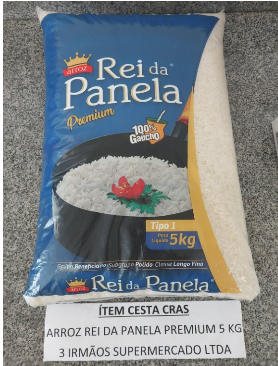
ÍTEM CESTA CRÁS ARROZ REI DA PANELA PREMIUM 5 KG 3 IRMÃOS SUPERMERCADO LTDA