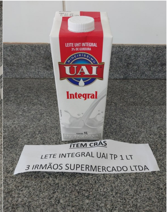
ÍTEM CRÁS LEITE INTEGRAL UAI TP 1 LT 3 IRMÃOS SUPERMERCADO LTDA