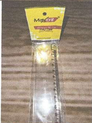
Régua de 30 cm Marca: Maxcristal