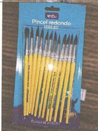
Pincel para pintura nº 20 Marca: Onda

BR AMMS noz engenho oncosta Rickante @Lucia