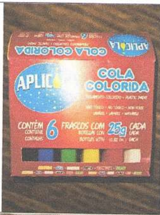
Cola Colorida 6 unidades 25g Marca: Aplicola