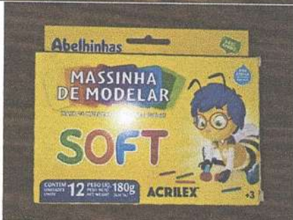
Massinha de modelar 12 unidades 180 g Marca: Acrilex