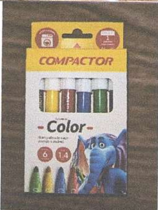
Pincel Hidrocor 6 cores Marca: Compactor