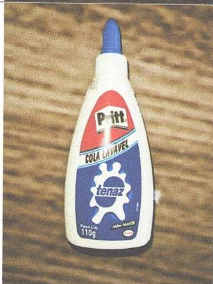
Cola branca tenax 110g Marca: Pritt