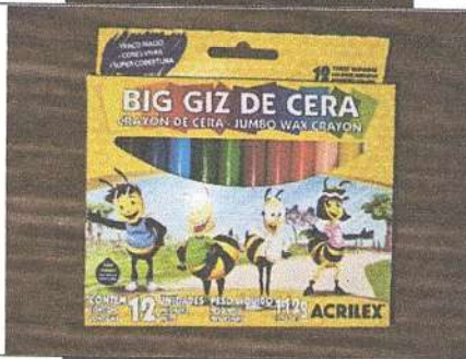
Giz de Cera 12 cores 112 g Marca: Acrilex