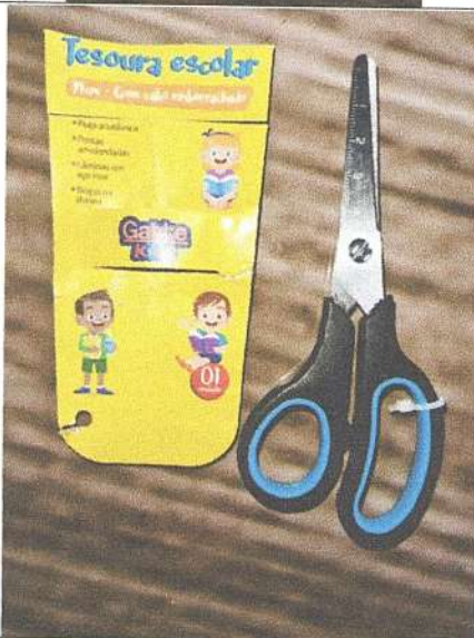
Tesoura Escolar 14 cm com cabo emborrachado Marca: Gatte Kids