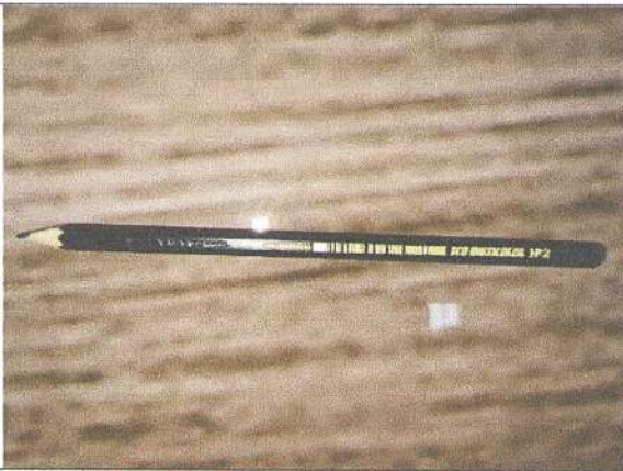
Lápis preto nº 2 Marca: ECO Multicolor