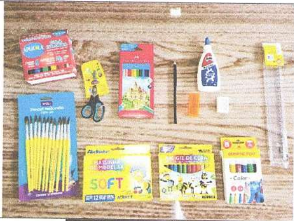
Conjunto Kit Escolar