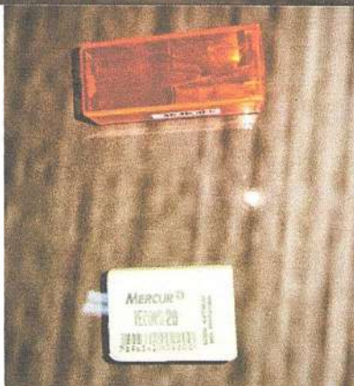
Apontador com depósito Marca: Faber-Castell